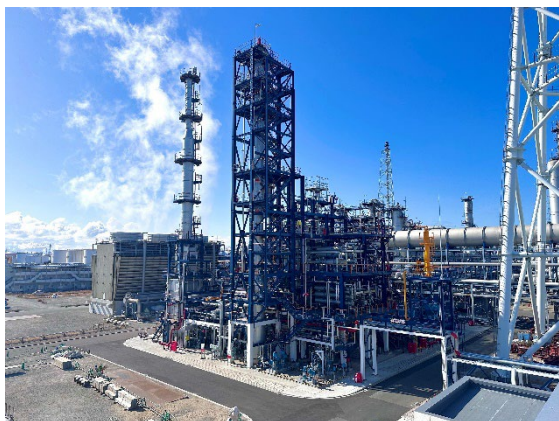
完工した SAF 製造装置 (コスモ石油堺製油所構内)