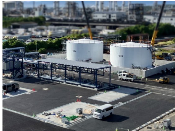
SAF の原料となる廃食用油受け入れ施設 (コスモ石油堺製油所構内)