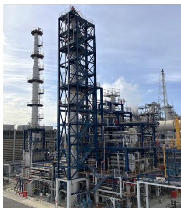
完工したSAF製造設備 (コスモ石油堺製油所構内)

※NEDO ホームページ： https://www.nedo.go.jp/koubo/FF3_100312.html