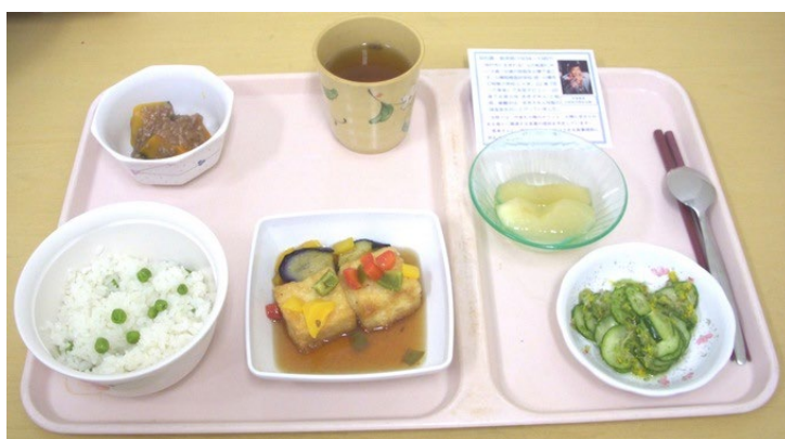
同院で提供する揚げ出し豆腐をメインとした「裕次郎御膳」