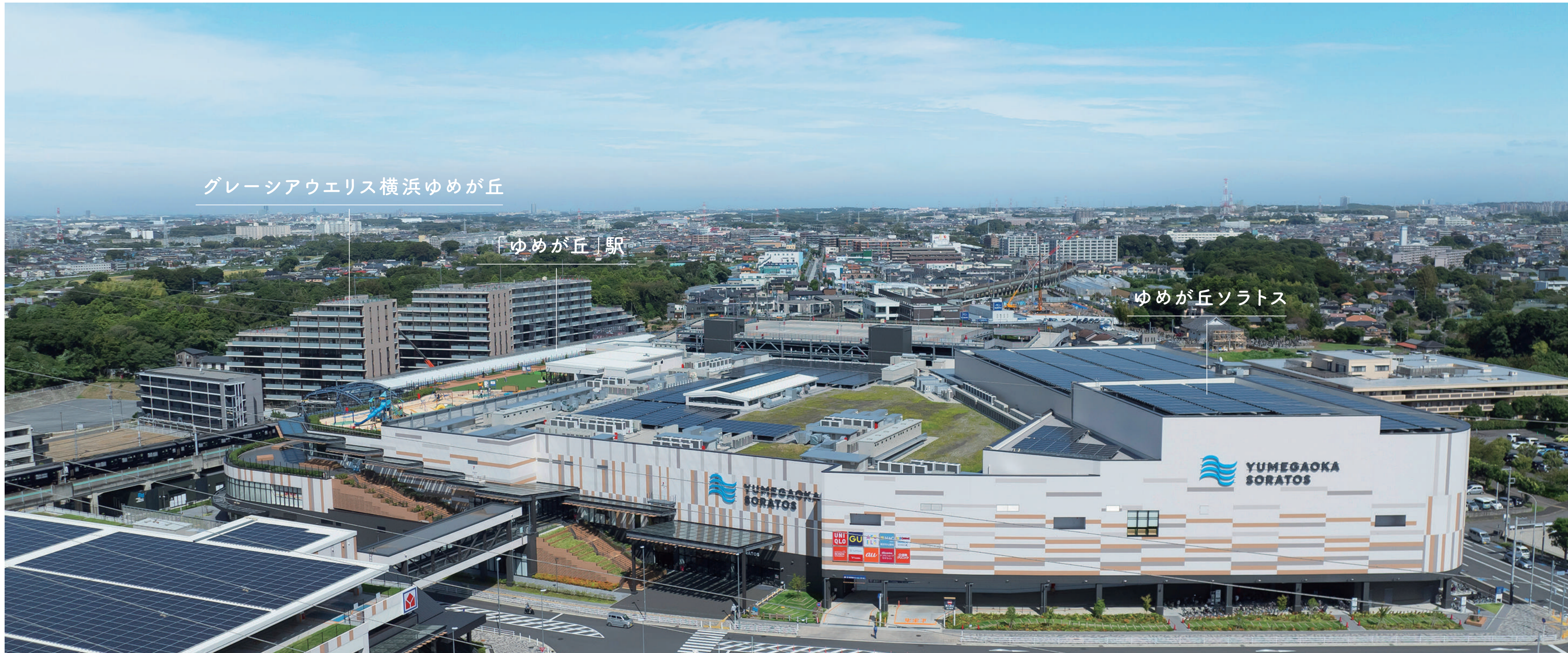
グリーンアウレリス横浜ゆめが丘