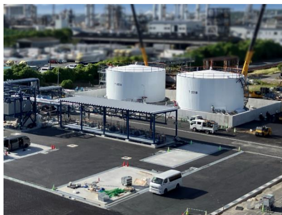
SAF の原料となる廃食用油受け入れ施設 (コスモ石油堺製油所構内)