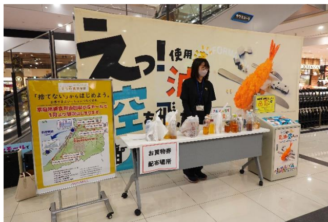
(上) (左) 廃食用油回収の様子