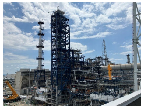
大阪府堺市で建設中の SAF 製造工場の様子

https://www.nedo.go.jp/koubo/FF3_100312.html