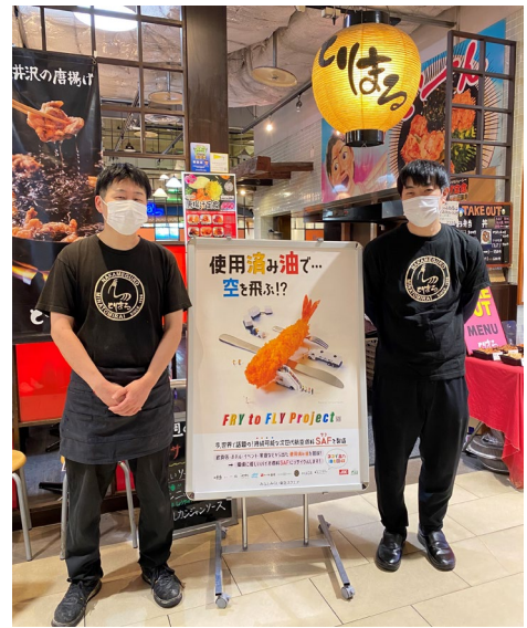
参加店舗での周知イメージ