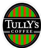
<タリーズコーヒー>