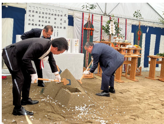
起工式の様子（鍬3名 写真左手よりレポインターナショナル、コスモ石油、日揮 HD の代表）