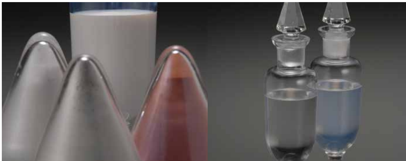
化粧品材料のシリカパウダー