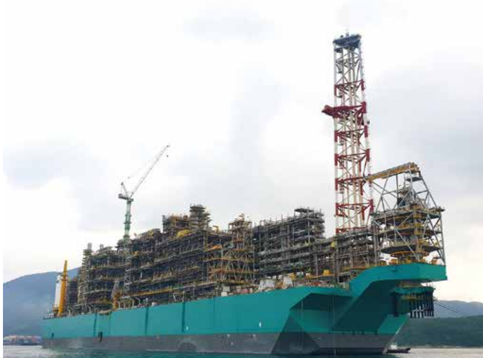
FLNG プラント(マレーシア)

日揮グループは、世界でも限られたエンジニアリング会社しか手掛けることのできない FLNG (洋上 LNG 設備) の遂行実績を有し、更には FPSO (洋上石油・ガス生産貯蔵出荷設備) では、技術的難易度が高い LPG-FPSO を実現するなど世界トップクラスのプロジェクト遂行実績を有しています。これらのプロジェクトの遂行を通じて蓄積した技術・知見を基に、オフショア分野での積極的な事業展開を進めています。