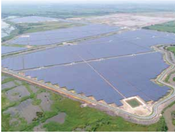
太陽光発電所(ベトナム)

日揮グループは、日本で再生可能エネルギーの固定価格買取制度が導入された2012年にいち早く太陽光発電分野に参入し、これまで多数の太陽光発電所建設プロジェクトを遂行するだけでなく、発電事業者としても実績と知見を蓄積してきました。海外においても、ベトナムではグループ会社と連携し複数の大型太陽光発電所の建設実績を有するほか、モンゴル向けに蓄電システム併設型の太陽光発電設備建設プロジェクトを遂行するなど、発電のみならず、蓄電、送電を含めた最適なエネルギーマネジメントソリューションをご提案しています。