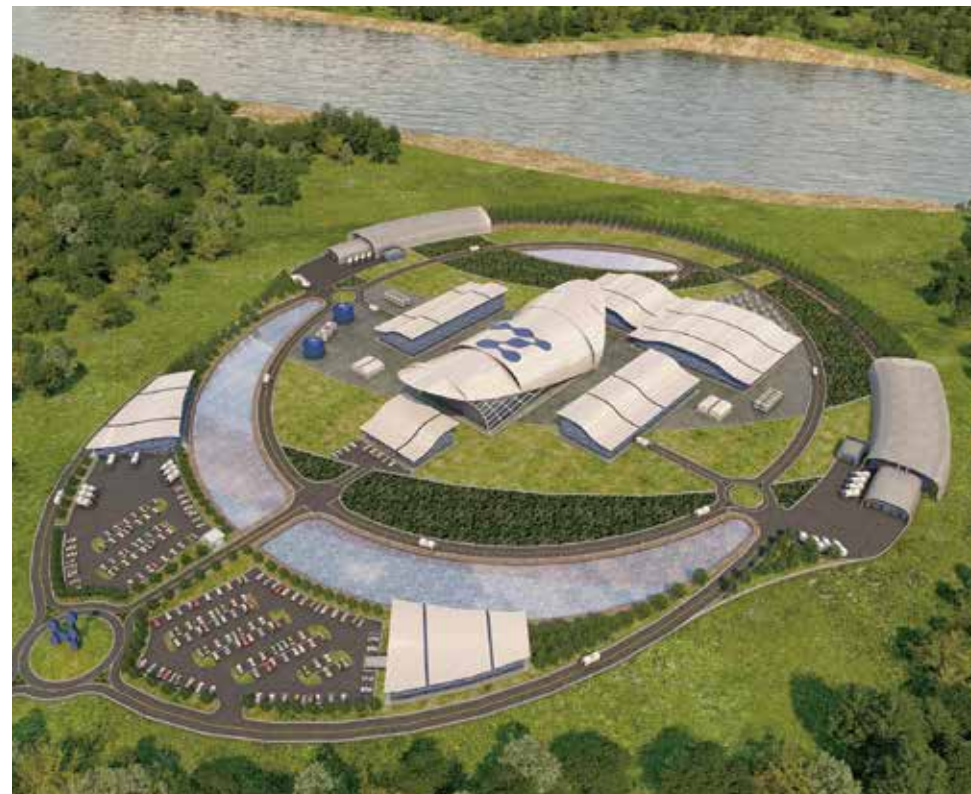
SMR 発電所の完成予想図

日揮グループは、国内外で放射性廃棄物の処理・処分施設や使用済燃料の再処理施設の設計・建設工事を数多く遂行してきました。また、その知見を活かし、海外の原子力発電所建設プロジェクトにも積極的に参画した経験を有しています。更に水素や再生可能エネルギーと並んで脱炭素社会の実現への貢献が期待できる、安全性の高い小型モジュール原子炉(SMR*)のEPC事業にも進出しています。