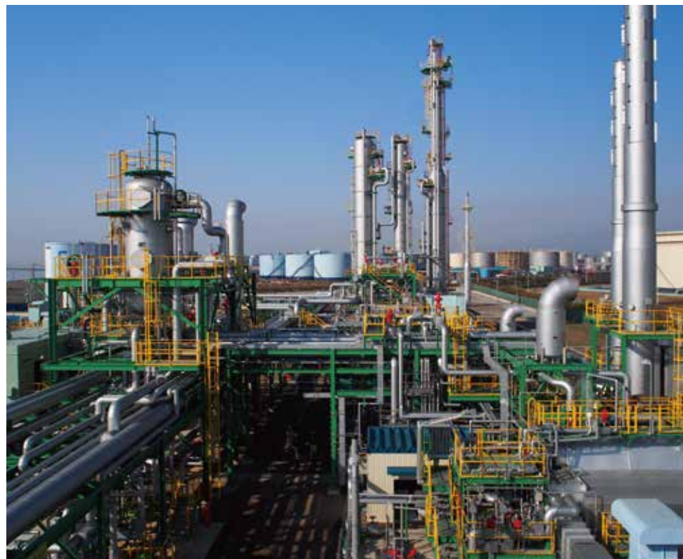
CCS 実証設備 (日本)

温暖化対策の切り札として、近年、CO 2 を回収し、地中に圧入・貯留するCCS ※1 や、回収したCO 2 を有効利用するCCUS ※2 に対する期待が高まっています。日揮グループは国内のみならず、アルジェリアやオーストラリアでCCS設備を建設した実績を有します。また、CCS設備の設計・建設のみならず、CO 2 分離に係る技術開発、更には事業計画段階からのソリューション提供や、カーボンクレジット創出のための事業参画にも積極的に取り組んでいます。