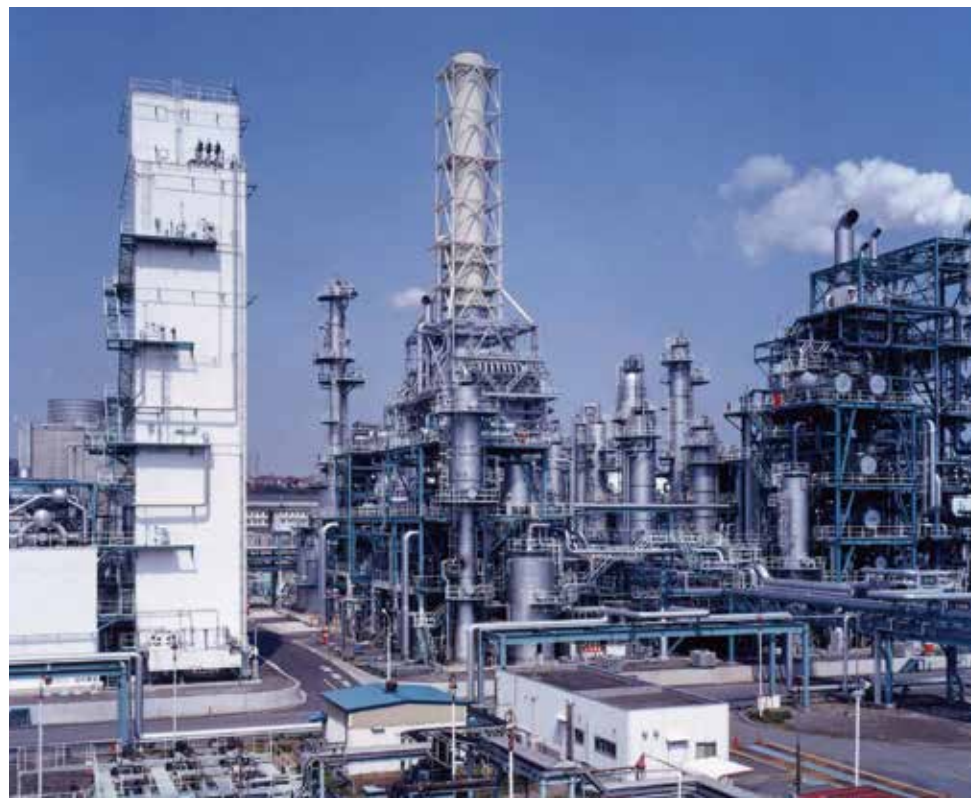
ガス化複合発電プラント(日本)

日揮グループは、国内外で石油、天然ガスなど多様なエネルギーを原料とする火力発電所建設プロジェクトの遂行実績を有します。また、残渣油を原料とするガス化複合発電を世界で初めて一括して設計、建設したほか、LNG受入基地のタンクから発生するボイルオフガスを利用した発電システムの開発など、新たな発電技術の開発・活用にも積極的に取り組んでいます。