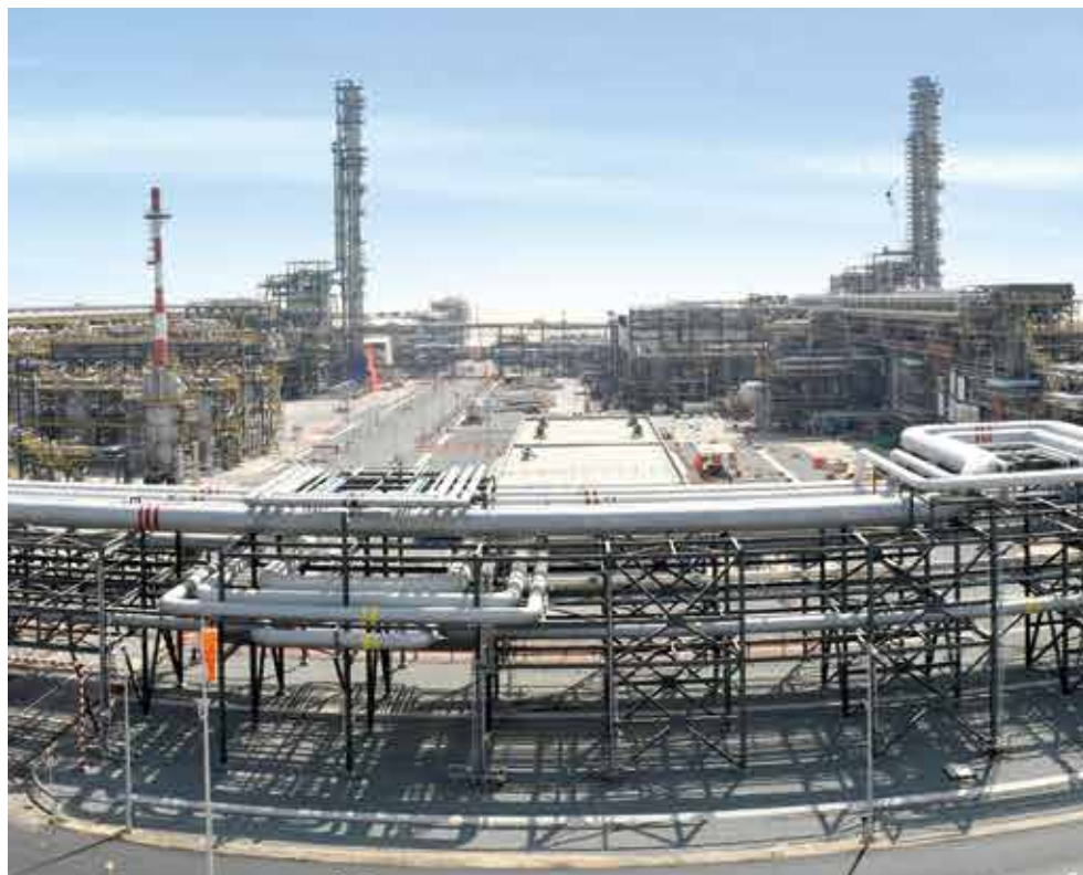
ガス処理プラント(U.A.E.)

オイル&ガスのアップストリーム分野では、中東、北アフリカ、東南アジアで原油・ガスの集積設備、分離プラント、昇圧設備など、数多くのプロジェクトの遂行実績を有しています。また、メジャーオイルや産油・産ガス国営石油会社による資源開発プロジェクトの計画段階から積極的に参画し、開発計画の支援からプラント建設、オペレーション・メンテナンスに至るまで、総合的な提案を行うことで、投資効果の最大化とスピーディーな開発計画の実現に寄与しています。