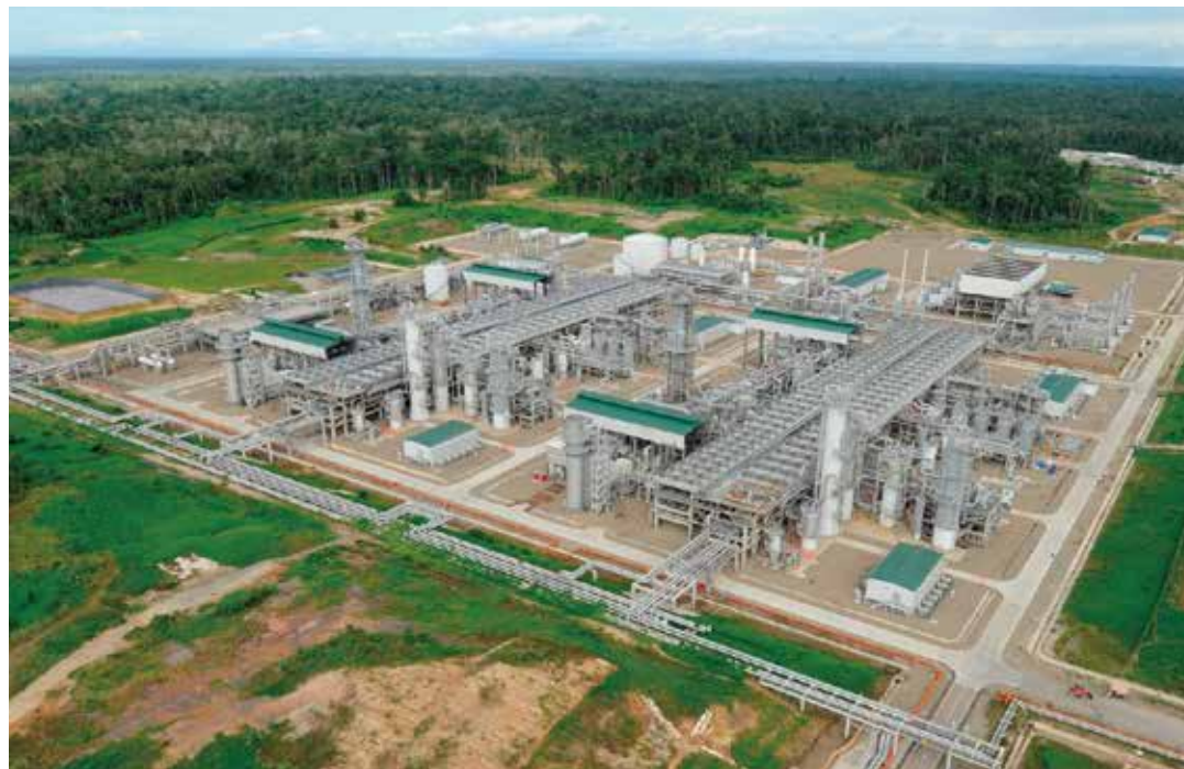
LNG プラント (インドネシア)

LNG は、CCS などの環境負荷を低減する技術との組み合わせにより、低・脱炭素社会への移行を支えるトランジションエネルギーとしての役割が期待されています。これまで世界の生産量の 30% 以上を占める LNG プラントを設計・建設した実績を有する日揮グループは、その優れたエンジニアリング技術によって、生産量拡大だけでなく、効率性の向上やカーボンニュートラル LNG*への移行など、更なる低・脱炭素化への対応も推進しています。