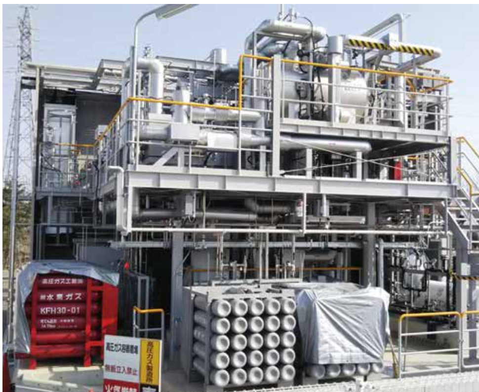
アンモニア合成実証試験装置（日本）

日揮グループは主要な水素キャリアの中でも、水素密度が高く、すでに大規模なサプライチェーンが確立しているアンモニア(NH 3 )に大きな強みを持っています。現在、国立研究開発法人新エネルギー・産業技術総合開発機構(NEDO)のグリーンイノベーション基金事業の一環として、旭化成(株)と共同で再生可能エネルギー由来の水素を原料とするグリーンアンモニア*などのグリーンケミカル製造プラントの実証事業を進めており、効率的・安定的なグリーンアンモニア製造技術の確立を目指しています。加えて国内外における水素・燃料アンモニア製造プロジェクトにも計画の構想段階などから参画し、お客様の設備投資計画の実現をサポートしています。