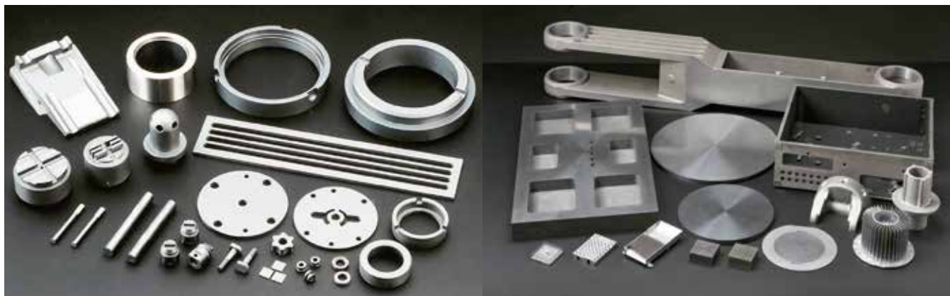
エンジニアリングセラミックス部品