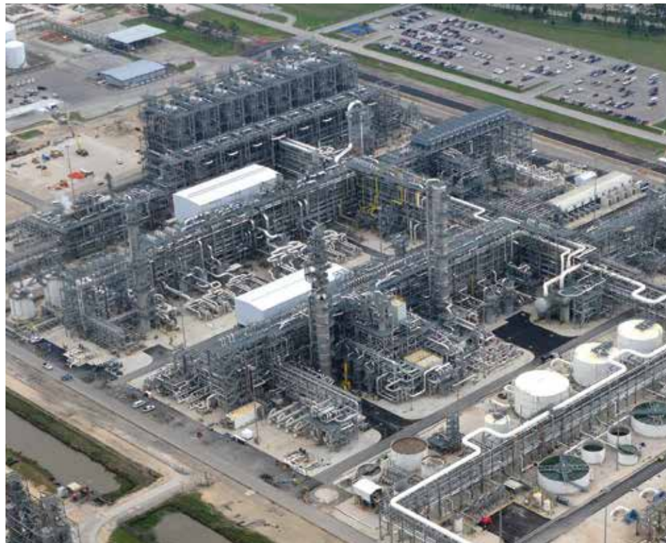
エチレンプラント(米国)

日揮グループは、天然ガスやシェールガスを原料とするガス化学分野で、大型エタンクラッカーを中心に下流の化学プラントを含めて、中東、米国、アジアで大型プロジェクトの遂行実績を有しています。加えて、日本の化学産業の海外進出計画にも、海外グループ会社と連携してお客様の事業計画を強力にサポートしているほか、日本国内においてスペシャリティケミカルなど付加価値の高い製品の製造設備の実現に貢献しています。