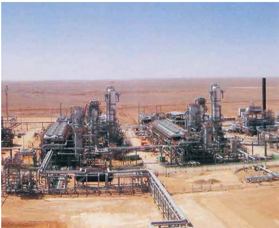
ガス処理プラント・CCS 設備 (アルジェリア)