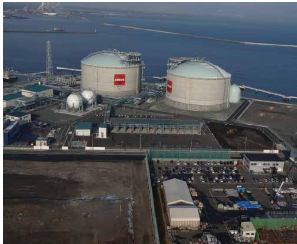
LNG ターミナル(日本)

日揮グループは、日本国内の受入基地建設においても、3分の1以上の設備への参画実績を有しています。近年、アジアを中心とする新興国では、急激な人口増加に伴う電力需要の増大や、経済成長に伴う都市化を背景に、LNG/LPG 受入基地の建設計画が増加しています。日揮グループは豊富な実績を活かし、これら計画を具現化し、各国のエネルギー政策の実現をサポートします。