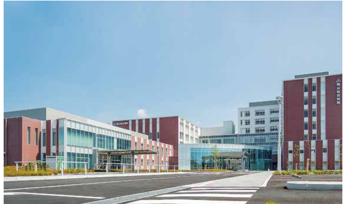
熊谷総合病院建替え工事（埼玉県）

高齢化社会の急速な進展、医療制度の改革などを背景に、将来を見据えた新たな施設づくりが求められています。日揮グループは全国各地で、経営、運営計画、計画／設計／建設、設備機器導入、情報インフラ構築、環境／防災計画、移転計画、保守管理などを一貫した思想で統合・最適化する数多くの病院・医療施設の建設プロジェクトを遂行しています。また、国内での病院PFI事業で培った病院運営ノウハウを活かし、海外においても病院経営事業に取り組んでいます。さらに、健康寿命を延ばすための「予防医療」に貢献していくことを目指して、病院・健診センターにデジタル技術を導入して医療データを収集／分析し、医療の質の向上や健康維持につなげるデジタルヘルスケア事業を展開しています。