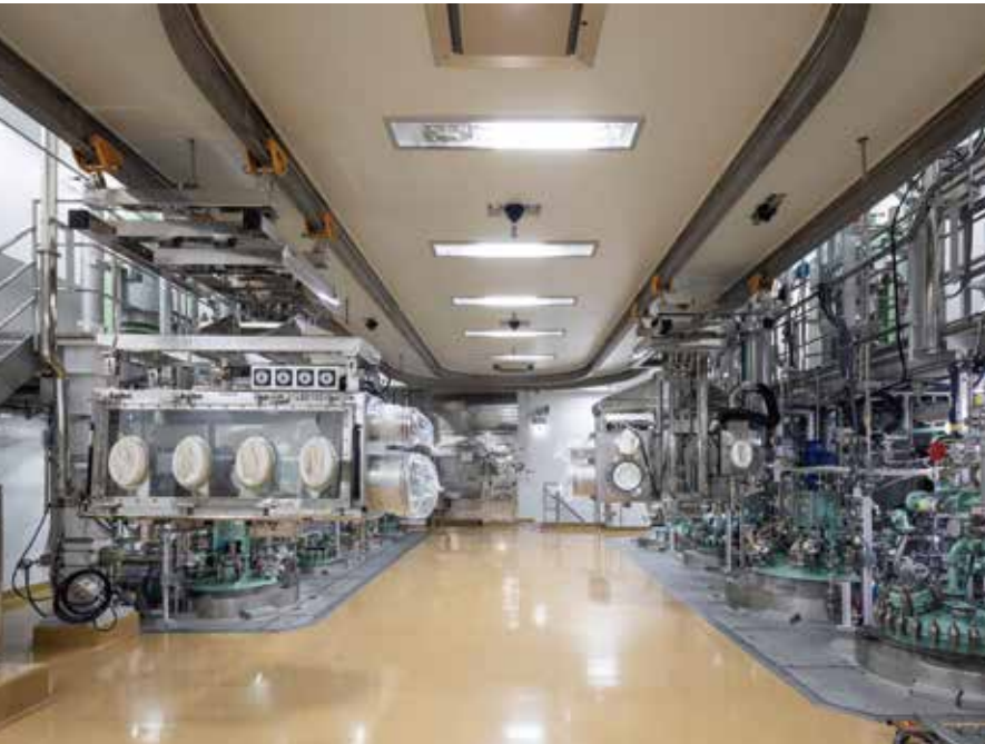
中外製薬(株)向け低・中分子合成原薬製造棟内の、高薬理活性の化合物の暴露から作業を守る次世代封じ込め技術を導入した設備